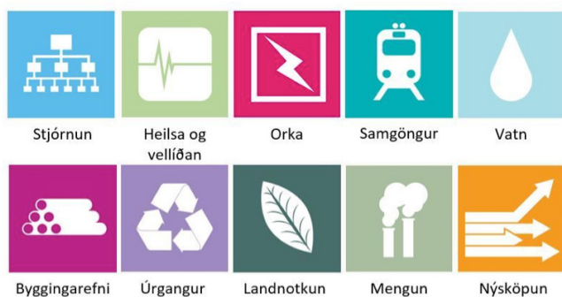
Mynd 2. Matsþættir í BREEAM.

Stigafjöldi fyrir hvern matsþátt er margfaldaður með hlutfallslegu vægi hvers þáttar. Heildarstigafjöldi er síðan lagður saman og myndar lokaeinkunn.