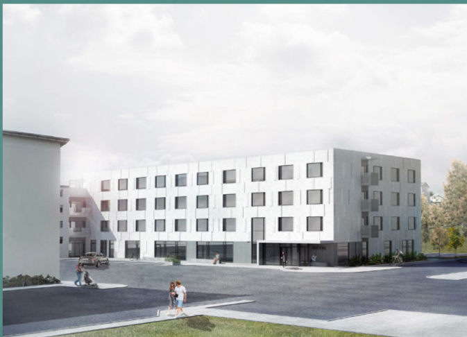
Mynd 1. Sjúkrahótelidð við Hringbraut er með BREEAM vottun.