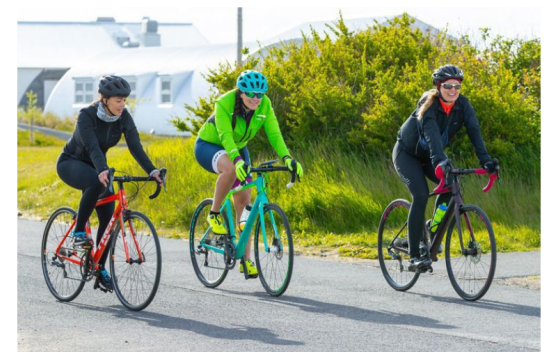
Þessi mynd er tekin síðasta sumar en miðað við sölu á reiðhjólum undanfarið má gera ráð fyrir að hjólafolkfi fjölgi núna í vor og sumar.